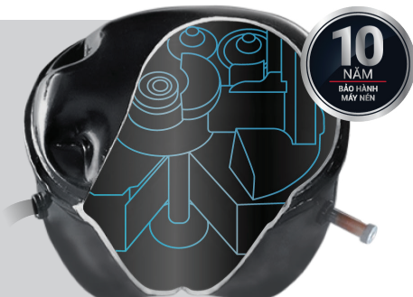
*Hình ảnh mang tính chất minh họa.

Tủ lạnh Hitachi sử dụng máy nén Inverter điều khiển điện tử giúp tiết kiệm điện. Máy nén cho khả năng làm lạnh mạnh mẽ và độ ồn thấp hơn.