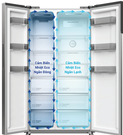
*Hình ảnh mang tính chất minh họa.

Tủ lạnh Hitachi có hai Cảm biến nhiệt Eco, một ở ngăn đông và một ở ngăn lạnh. Các cảm biến phát hiện nhiệt độ thay đổi ở từng ngăn, giúp duy trì nhiệt độ lý tưởng tại từng thời điểm.